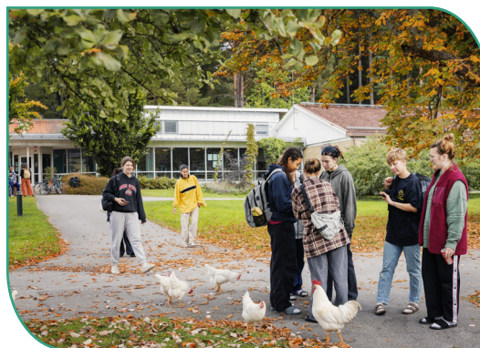
Bildbanken uppdaterades med foton från två folkhögskolor.

Under året har vi arbetat intensivt med att ta fram material att använda när vi sprider ordet om folkhögskolan bland våra prioriterade målgrupper. Ledorden har varit: rörligt först! Vi har jobbat mer med rörligt material och reels, och utgått från deltagarna och deras egna berättelser.