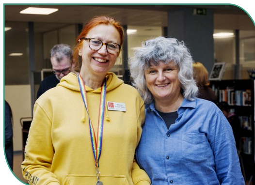
Fler vill stötta folkhögskolan.

För att få fler beslutsfattare att känna till och se fördelarna med folkhögskola har vi löpande under året producerat och spridit nyhetsartiklar, debattartiklar, remissvar och pressmeddelanden. Även aktuella och relevanta externa artiklar och rapporter har spridits via webb och sociala medier.