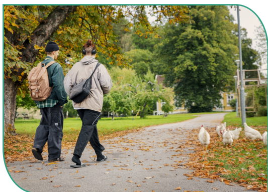
FSO har bidragit med innehåll, expertis och arbetstid.

Revisionen av projektet Min story – vår agendas andra år har fått godkänt av Arvsfonden. Vi fortsätter ett tredje år enligt befintliga rutiner i samverkan med RIO och OFI. Projektet slutredovisas i september 2024.