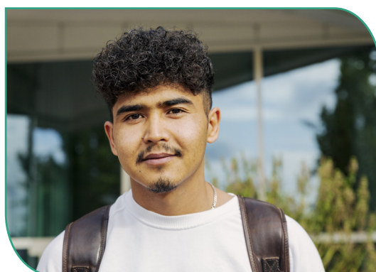
Skolorna har bidragit med deltagarberättelser.

Under 2023 lanserades Google Looker Studio som statistikverktyg för folkhögskolorna. Här kan de enskilda skolorna gå in och se hur deras egna sidor på folkhögskola.nu presterar, till exempel hur många som besöker deras skol- och kurssidor och hur många som klickar på knappen Ansök nu på varje kurssida. Vi på FSO och webbyrån Metamatrix använder Google Analytics 4 för att analysera webbstatistik, som används som underlag vid utveckling av webbplatsen folkhögskola.nu.