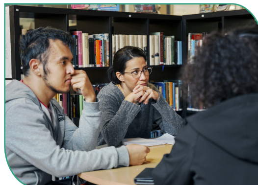
Framtidens skoladministrativa system har diskuterats.

Även arbetet med fokusgruppen, beredningsgruppen och förvaltningsgruppen har fortsatt. En ny fokusgrupp landsattes. Gruppens fokus är att bredda förståelsen för det administrativa arbetet i Schoolsoft på nationell nivå, inklusive utvecklingen av feedbackloopar.