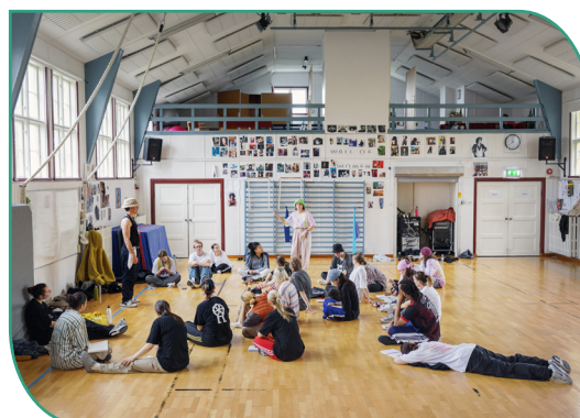
Folkhögskoleenkäten blir tillgänglig för fler deltagare.