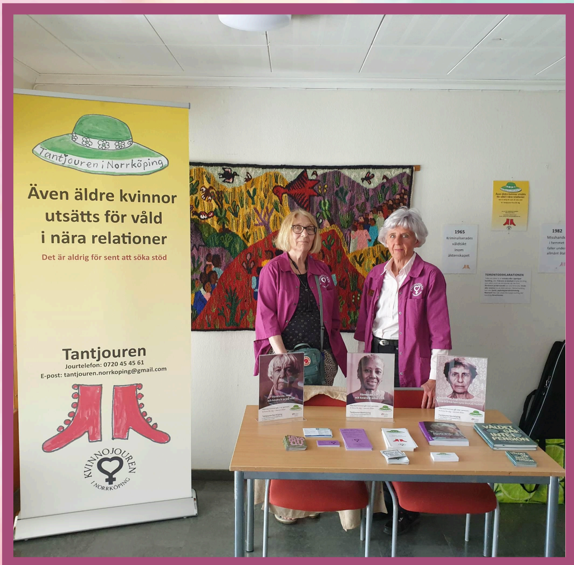
Tantjourens och kvinnojouren i Norrköpings bokbord: